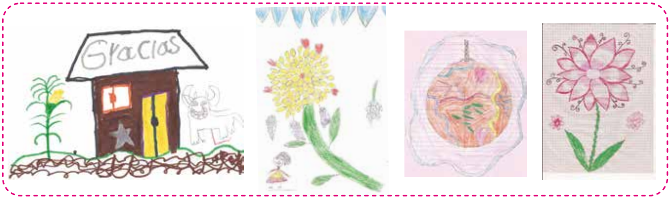
Estos son algunos de los dibujos elaborados por los niños y niñas